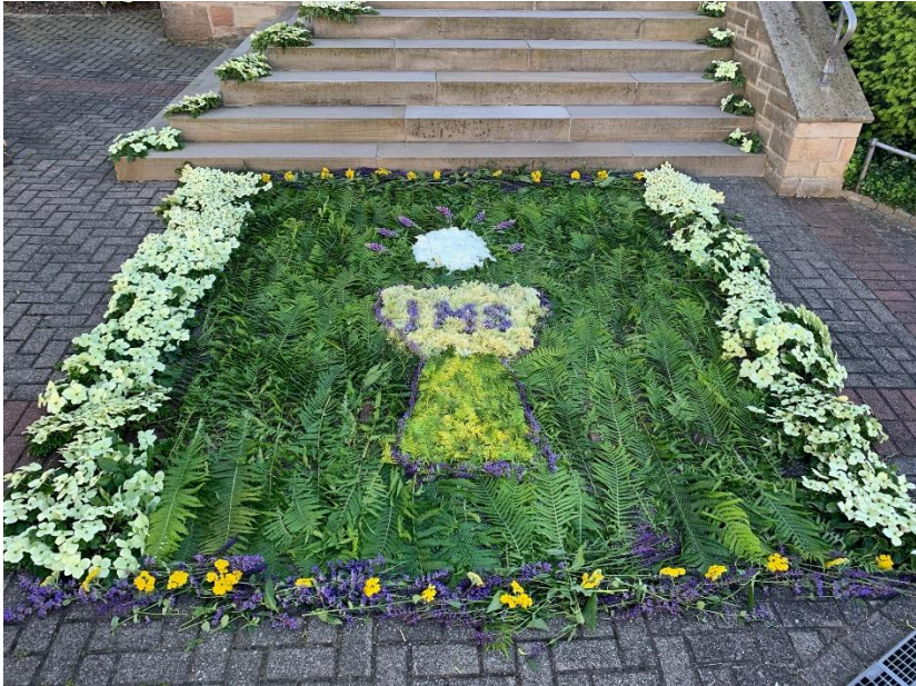
Bild: Prozession in Erlinghausen